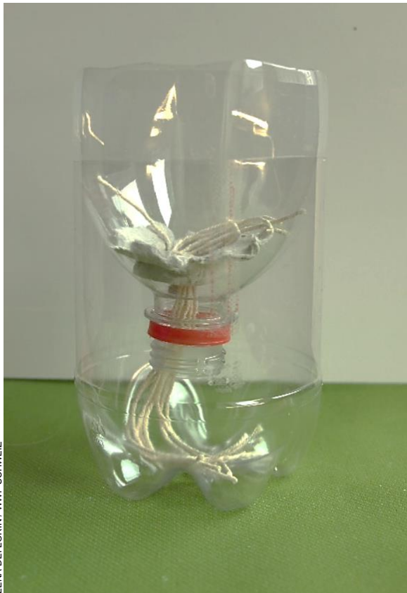
LENA DEFLOREN / WWF SCHWEIZ